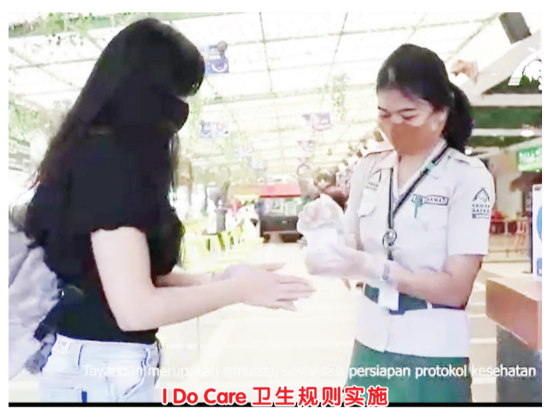
I Do Care 卫生规则实施