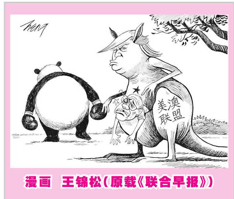
漫画 王锦松(原载《联合早报》)

疫情对国际贸易有影响,并不意味着各国不能开放流通。各国要加强抗疫信息共享,避免采取极端政策对国际运输特别是抗疫物资运输造成不必要干扰。要保持国际市场开放,保护稳定的贸易和投资环境,避免全方位封闭导致供应链中断且难以恢复,对经济造成二次系统性损害。要加强贸易伙伴的沟通协调,解除不必要的贸易限制措施,共同推动贸易