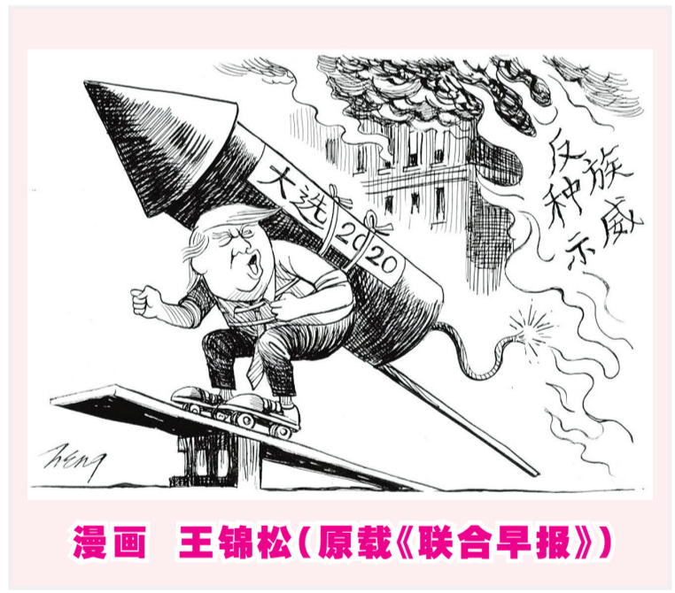
漫画 王锦松(原载《联合早报》)

日本《朝日新闻》30日称,中国领导人对日本访问虽因新冠疫情而延期,但是两国在经济方面加强合作的局面没有变化。安倍的辞职是否证明他的时代已经结束了?新选的日本首相是否“萧规曹随”,或者更彻底地紧抱特朗普的大腿?大家拭目以待。