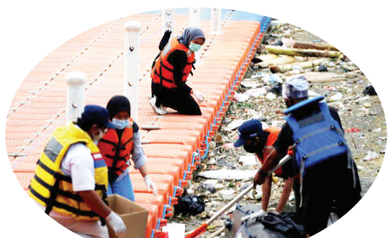
在西萨丹河床找到注射器、口罩、防护服等各种医疗垃圾