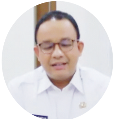
阿尼斯在视频会上致词