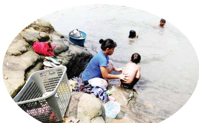
一名妇女为 6 岁的孩子在西萨丹河里洗澡

后，他们开始在河里找到注射器、口罩和防护袍等各种医疗垃圾，“在最初阶段，我们每天都会找到五六十件。”